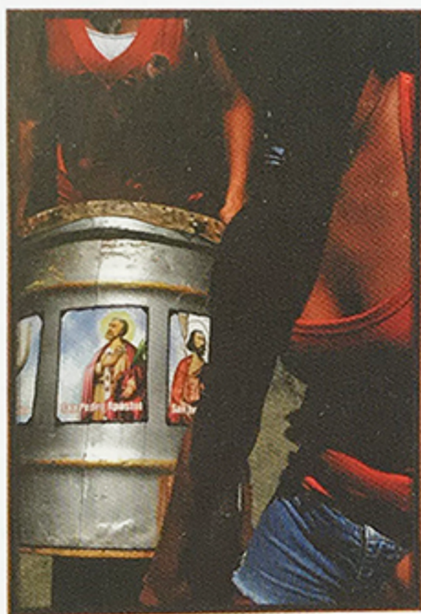
Cuerosanto , 2010 | MARTHA VIAÑA Fotografía e impresión digital sobre papel 112 x 76 cm