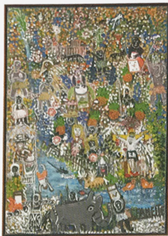
JOSÉ FANEITE | Los tambores me llamaban , 2009 Mixta sobre tela 126 x 85 cm