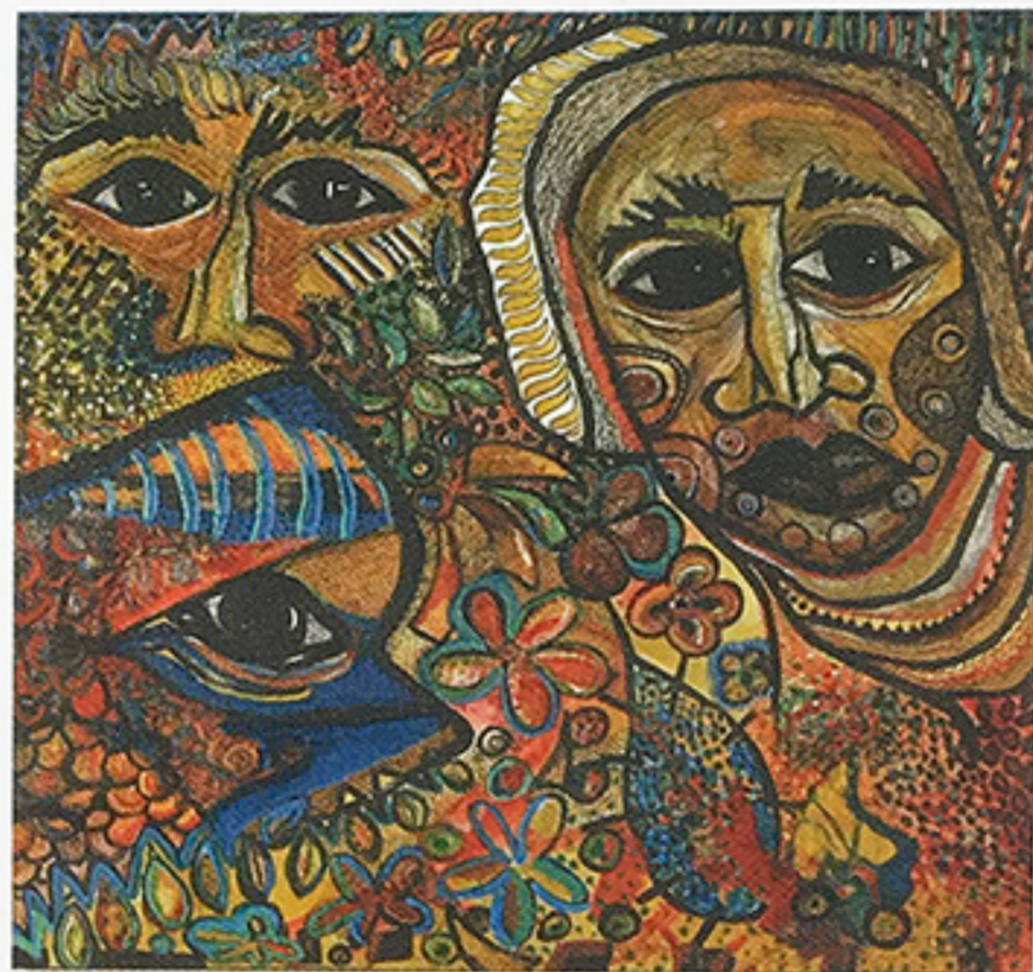
ZULAY PIÑA | El mundo de Ana G , 2010 Mixta sobre tela 120 x 120 cm